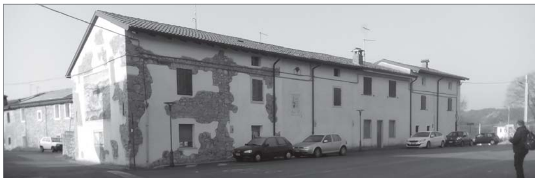
San Martino a harcok után (felső kép), illetve az „elvarázsolt ház”, amely egyedülként maradt épen (alsó kép)