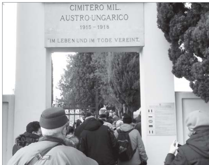
A foglianói osztrák-magyar hősi temető bejárata