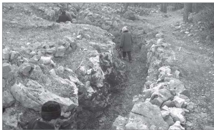
A San Michele utolsó előtti lövészárkvonala

rús múzeumban zártuk le, ahol minden egyes kiállított tárgy a Doberdó-fennsíkről származik, és a helyi barlangászok gyűj-