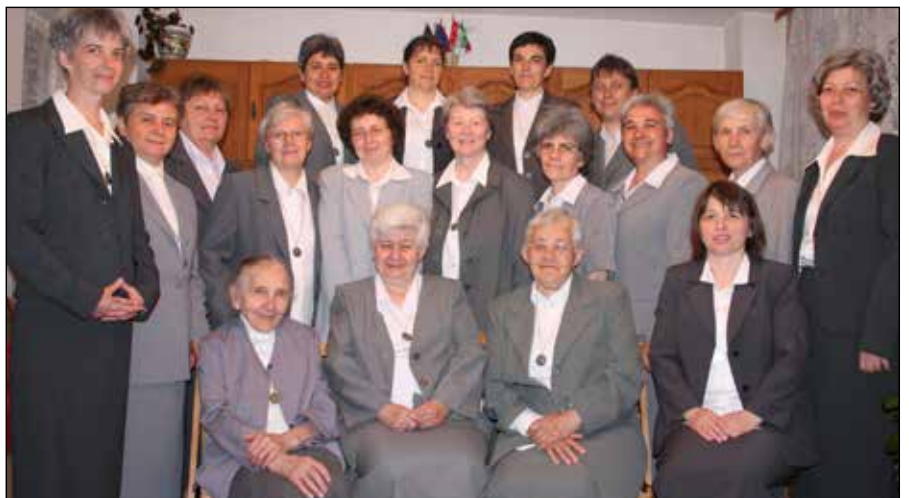
„A modern kor igényeire figyelve szolgáljuk az evangelizációt.”

A Szentlélekkel való bensőséges kapcsolat tesz képessé most is a radikális Krisztus-követésre, arra, hogy a modern kor igényeire figyelve szolgáljuk az evangelizációt különböző lelkiségi mozgalmakban, kórházpasztorációban,