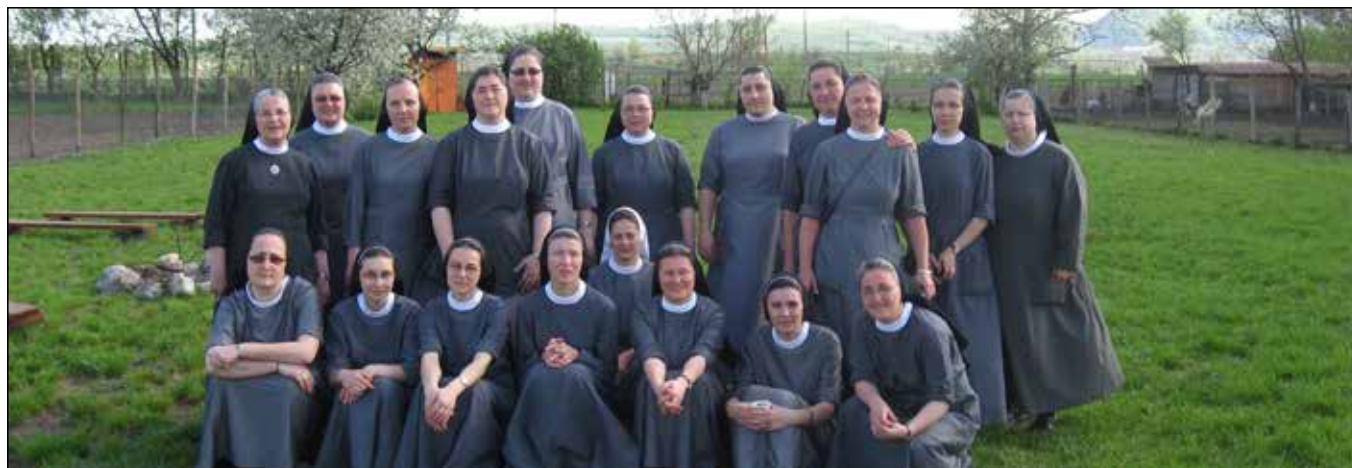
Az erdélyi mallersdorfi nővérek közössége