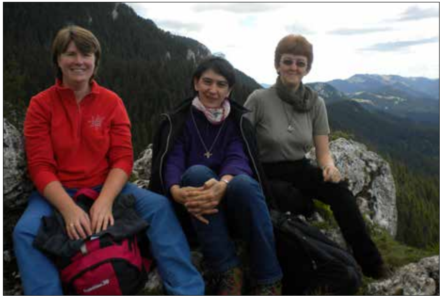
„Segíteni az embereket teremttségük céljának elérésében.”

Karizmánkat röviden így foglalnám össze: Krisztus-követésünk által segíteni akarunk azoknak, akik ezen a világon vagy a túlvilágon a tisztulás útját járják. Jelen akarunk lenni az élet különböző területein azok mellett, akik szenvednek, akiknek emberi méltóságuk kárt szenvedett, a kienyegszelődést és a reményt megélni és közvetíteni a legkülönbözőbb helyzetekben. Mottónk: „Segíteni az embereket teremttségük céljának elérésében.” Mindezt a legkülönbözőbb területeken próbáljuk megélni. Karizmánkból és lelkiségünkéből adódóan nincsenek intézményeink, kisközösségekben élünk. Tevékenységeink: a Szent Margit Lelkigyakorlatos Ház működtetése Csíkszentdomokoson (ahol a lelkigyakorlatokon kívül számos tematikus képzés is mű-