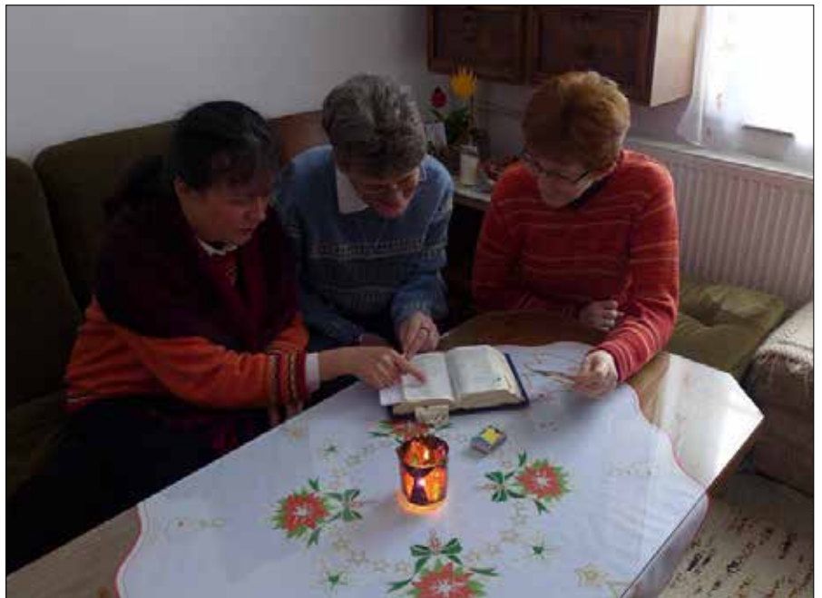
„Mindenben Istent szeressük, és neki szolgáljunk!”