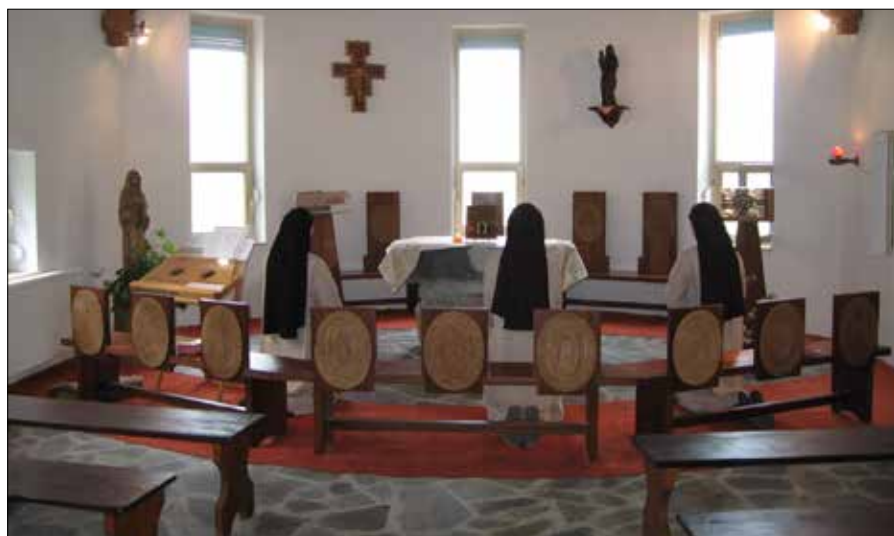
„A közösségre végzett imaórák liturgiája Krisztushoz kapcsol bennünket.”

A nap nap után ingyenesen kapott szeretet természetesen megosztásra hív bennünket. Mi abból szeretnénk adni testvéreinknek, amit mi kapunk az Úrtól. Örömmel várjuk azokat, akik részt szeretnének venni zsolozsmáinkon vagy a szentségimádáson. Ha valaki életútján szeretne megállni és letelepedni az Úr lábaihoz, annak különálló remetéseinkben néhány napra lehetőséget nyújtunk az elcsendesedéshez. A nap bizonyos szakaszaiban (9–11.45; 14.30–16.45; 17.30–18.30) imában fogadjuk azokat, akik becsöngetnek. Egyesek valamit meg szeretnének osztani Isten arcának kereséséből, mások megpróbáltatásaikban eljönnek, hogy a közös ima erejével, a hitben vállalni tudják életük kihívásait, vagy egyszerűen becsöngetnek, mert hallották, hogy vannak itt nővérek, akik meghallgatják őket, és imádkoznak értük. Ezekben a találkozásokban mindenkifölött az Úr akaratát keressük együtt.