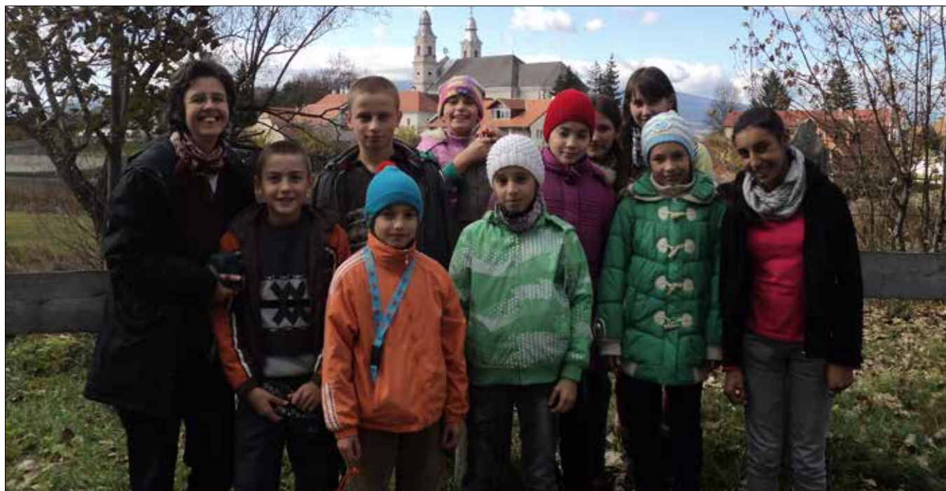
„Csíksomlyó számunkra forrás és csúcs.”