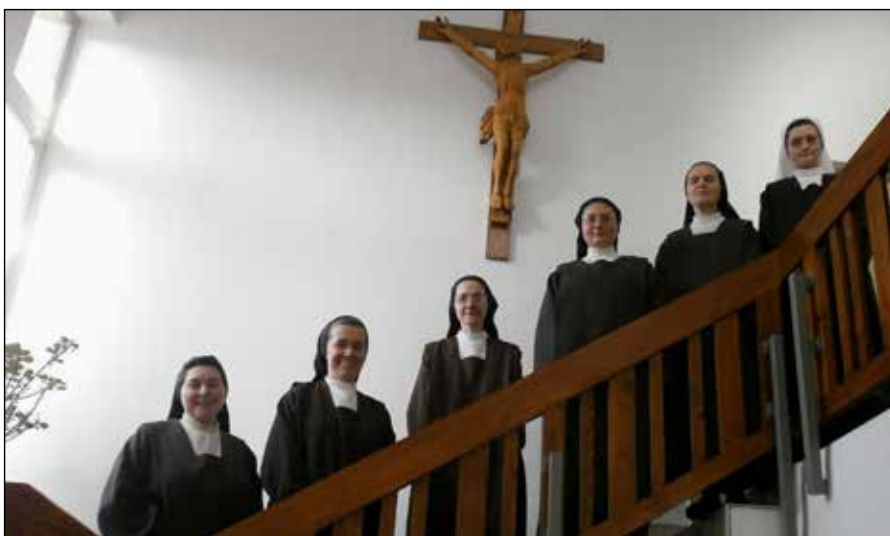
„A mi hivatásunk az, hogy ott álljunk Jézus keresztnél.”