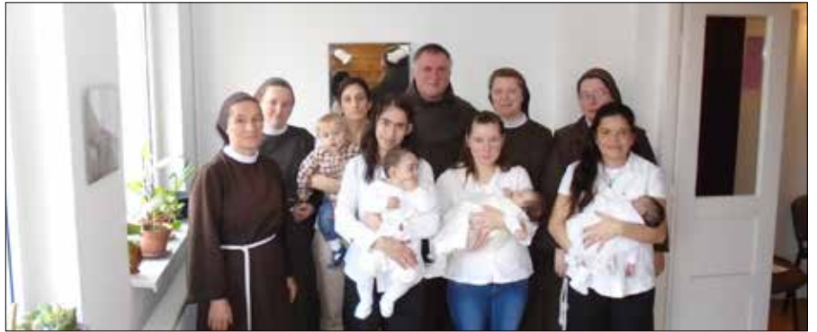
Kismamákkal és gyermekekkel árkosi otthonunkban

A Csíksomlyói Mária hívó szava a forráshoz vezet bennünket, szomjazókat. Egyénileg (szabadság, remeteség), csoportosan (szerzetesi találkozó), hétköznapiakon (pihenés, lelki nap) vagy ünnepek (a megszentelt élet napja, csíksomlyói búcsú, Porciunkula búcsú, Szent Ferenc elszenderülése) alkalmával jelenünk meg a Szűzanya előtt tiszteletünket tenni. Ki-ki feltárja előtte szívét, segítségét kérjük, legyen vágyaink, gyógyulásunk, megterésünk kieszközölője. Szeretteinket és mindenkit, akivel kapcsolatban állunk, a Szűz-