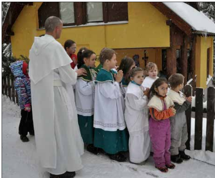
Hargitafürdőn a pálosok „kolostora” előtt

A Szűzanya nem volt hálátlan a pálosok évszázadokon keresztül tanúsított gyengéd szeretete iránt. Megőrizte őket, és amikor Lengyelország ismét önálló lett, rendünk is újból virágzásnak indult. Hazánkba is lengyelhonból jöttek vissza a pálosok. 1934 pünkösdjén telepedett meg ismét szülőföldjén a rend. Sajnos azonban alig másfél évtized után a kommunista államhatalom 1950 őszén a pálosok működését is betiltotta. A szétszórtságban élő szerzetesek azonban szívükben továbbra is megőrizték, sőt rejtve tovább is adták a pálos hagyományokat és lelkiséget. Nekik köszönhető, hogy 1989-ben a Pálos Rend újra megkezdhette közösségi életét.