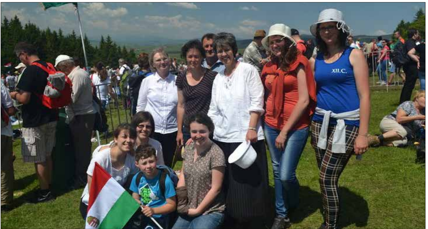
A csíksomlyói pünkösdi búcsún

a falu lelkeségén. Kájoni János, a zenészként is ismert polihisztor ferences tevékenységének egyik fontos helyszíne – Csíksomlyó és Szárhegy mellett – ez a Bekecs aljában megbúvó kis lelkes falu.