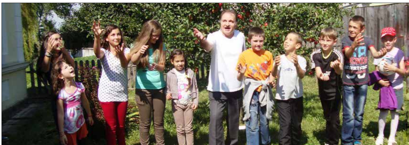
Gyermekkel a Piarista Tanulmányi Ház udvarán